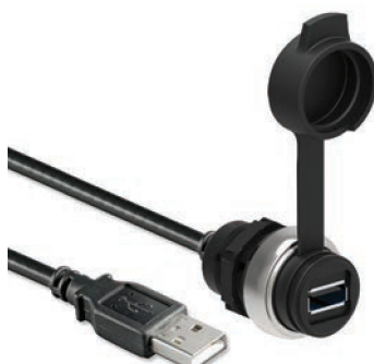
LPC D01 L...